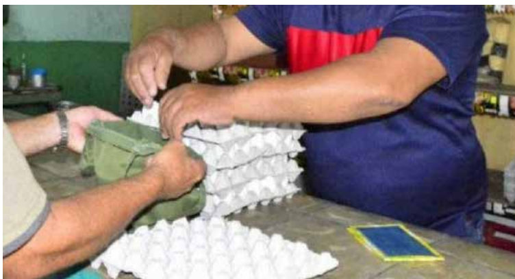
La distribución se realiza a razón de 10 huevos por consumidor.

Directivos de la Empresa Avícola en el territorio aclaran que esta venta no se realizará de forma mensual como se hacía anteriormente