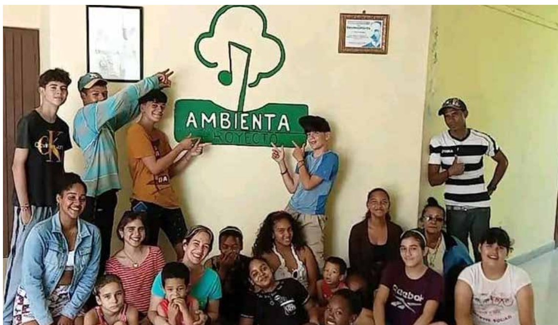
Ambienta se ha convertido en el hogar de niños y adolescentes que mezclan conocimientos y diversión.