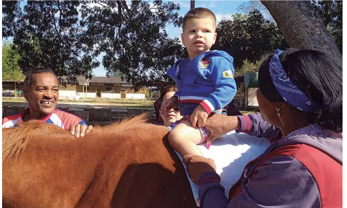
Sobre el caballo Muñeco cabalgan las esperanzas de los pacientes y sus familias.