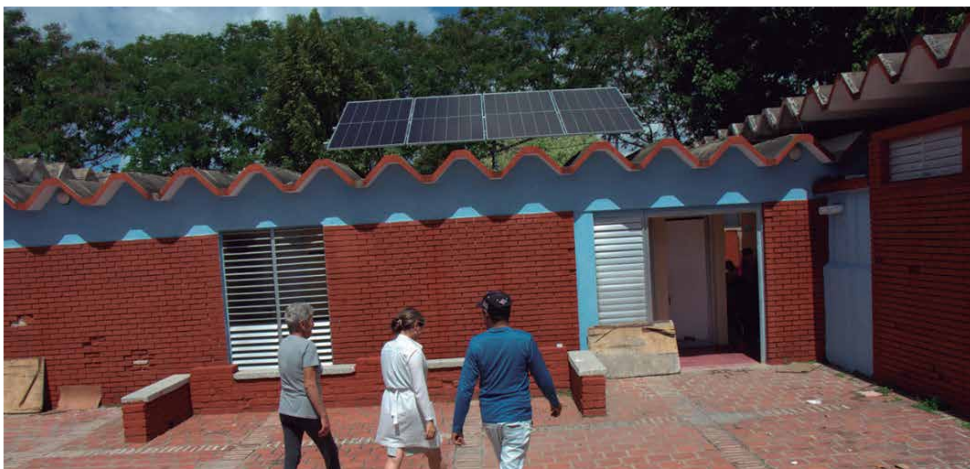
Los 23 policlínicos de la provincia contarán con paneles solares fotovoltaicos.