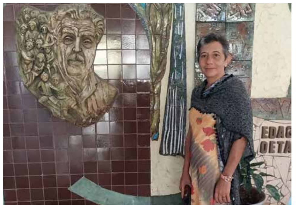
Lourdes cuenta con publicaciones de primer nivel en la revista Temas agrarios y en las tres ediciones del libro Soberanía alimentaria y desarrollo agropecuario y forestal .

Estos logros científicos le valieron el Premio Provincial de la Academia de Ciencias 2025, un galardón que no solo celebra sus méritos como investigadora, sino que ilumina el prometedor futuro de una científica dedicada a formar nuevas generaciones de profesionales y la incentiva a continuar investigando para construir una agricultura más sostenible.