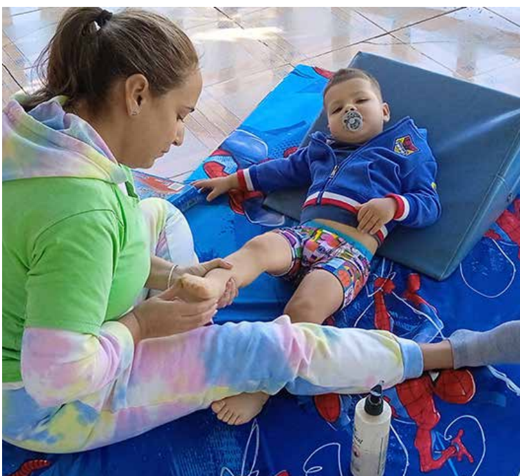
Con mucha entrega y amor trabajan los especialistas en el Centro Provincial de Equinoterapia.