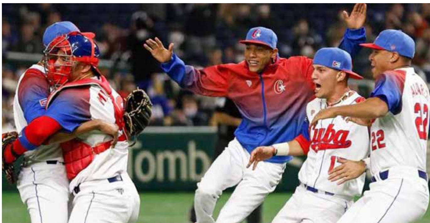
Cuba ha ganado más de lo que ha perdido: 18-14, y entre todas las selecciones que han tomado parte ocupa el quinto puesto en cantidad de triunfos.