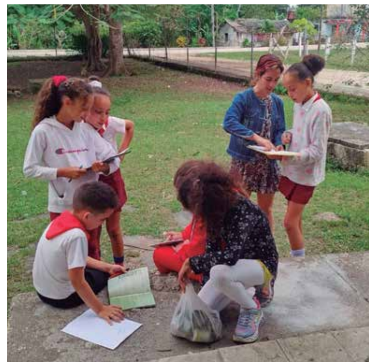
Los saberes compartidos son el plato fuerte de cada encuentro.