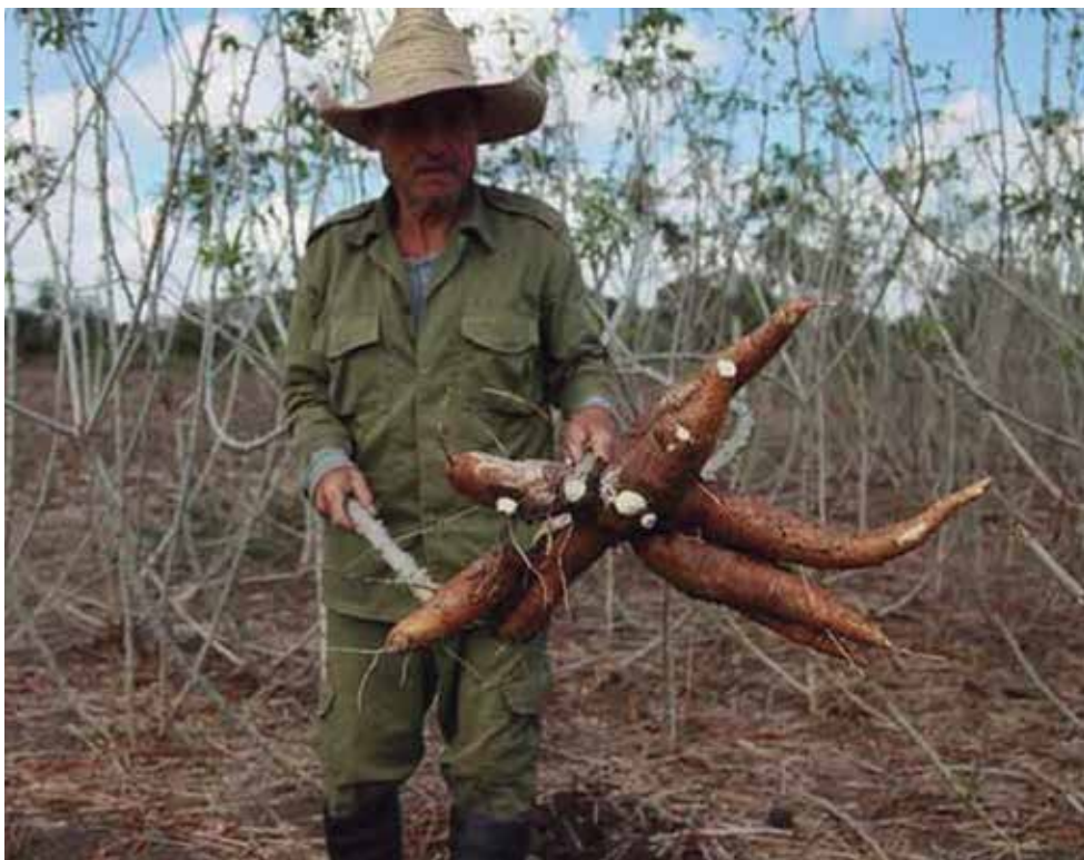
Varios quintales de yuca se han cosechado en el autoconsumo para beneficiar a los trabajadores y a la población.

Sin dudas, los trabajadores de Labiofam Sancti Spíritus —merecedores recientemente de la condición de Vanguardia Nacional por sus resultados en 2025— no se cruzan de brazos y enfrentan nuevos desafíos, entre ellos irle de frente al surco sin olvidar el laboratorio.