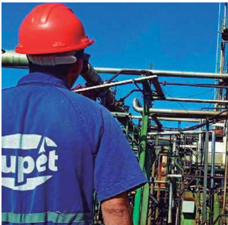
La Sergio Soto pone en práctica en la actualidad un grupo de proyectos con resultados palpables.

“La refinería ha procesado 400 toneladas por día, hoy está a 600, con capacidad para 800, y ya tenemos la proyección para llegar a las 1 000 toneladas diarias de refinación de crudo, nuestro principal objeto social. Además, se montó una torre de destilación atmosférica nueva, y no hubo que buscar fuerza externa ni de otro ministerio. Los ingenieros de aquí, los estudiantes, con las empresas de ingeniería de petróleo y la del centro de investigación de la universidad, acometieron todas las labores”, apunta Bonachea Crespo.