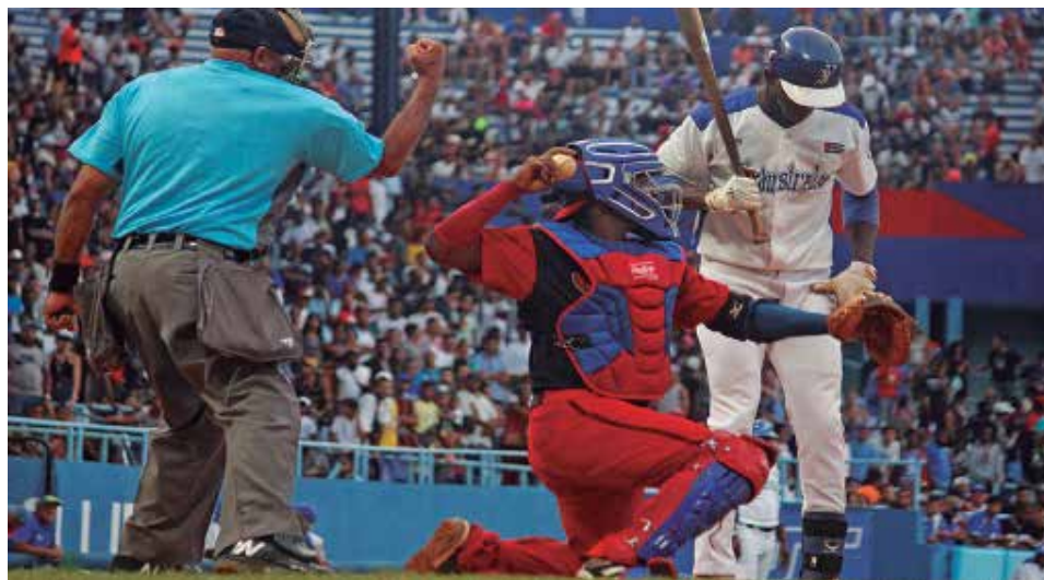
Seis equipos animarán la próxima edición del torneo beisbolero.

No hay muchos incentivos como no sean espirituales para lograrlo y en ello le va la vida a atletas, entrenadores y directivos no