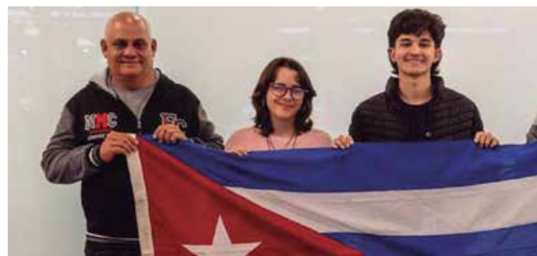
La delegación cubana estuvo integrada por estos dos jóvenes.