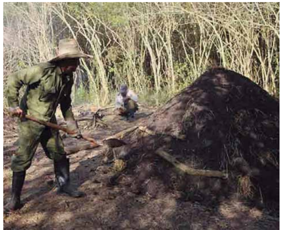
Labiofam Sancti Spíritus también incursiona en la producción de carbón vegetal para diversos fines.