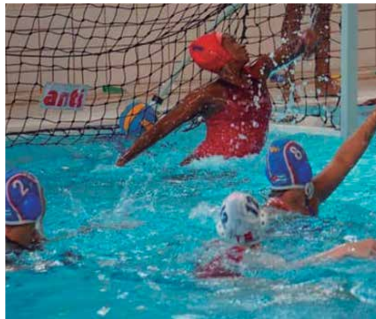
El polo acuático cubano registró una buena actuación en el torneo clasificatorio del deporte, que tuvo por sede la ciudad colombiana de Cali.

De paso, ya se inscribe como la disciplina con mayores aportes a la delegación que nos representará en la cita quisqueyana. (E. R. R.)