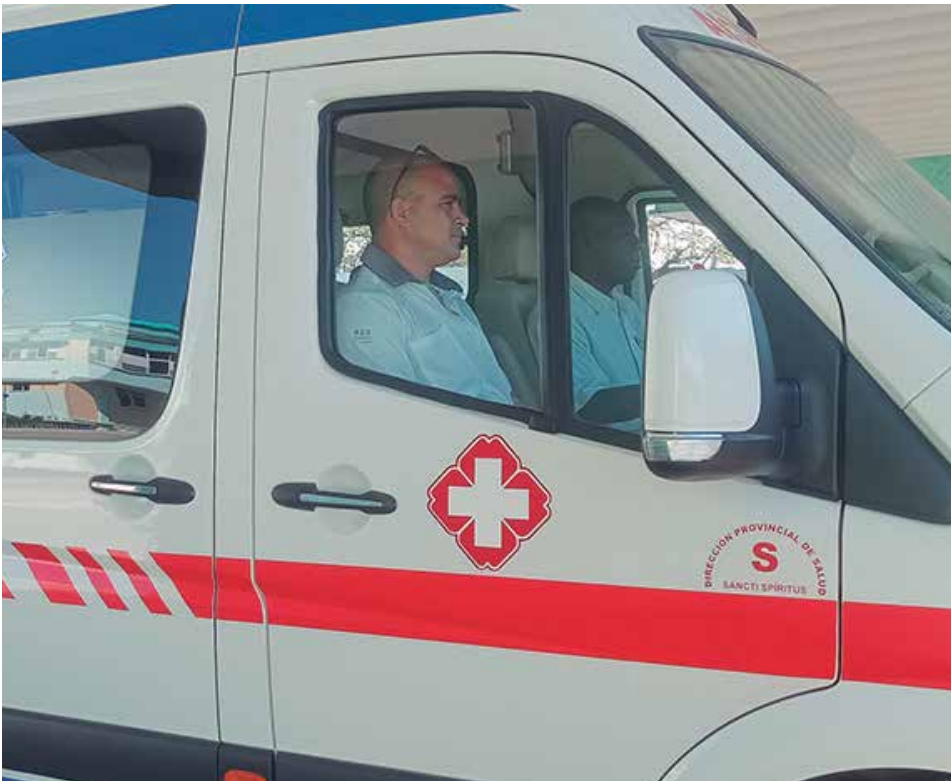
Las ambulancias en funcionamiento hoy no bastan para la respuesta rápida a las activaciones que a diario se producen en la Base Regionalizada No. 10 de Sancti Spiritus.

El impacto de esta política genocida del Gobierno de Estados Unidos resulta incuestionable en la baja disponibilidad técnica del parque de ambulancias y en el déficit de combustible para el traslado de los enfermos