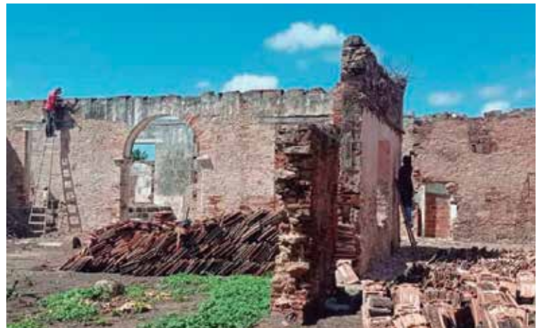
La Oficina del Conservador cuenta con un escaso financiamiento para ejecutar ese tipo de labores.

El compromiso, aseguró el directivo, es dar respuesta a cuatro objetos de obra que disponen de financiamiento: la reparación de la cubierta, la capilla y los muros del Cementerio Católico, la Casa Infantil de San Pedro, un parque de estar en lo que fue un microvertedero de la ciudad, y la antigua enfermería de esclavos en la comunidad de Manaca Iznaga, beneficiada por un proyecto de cooperación internacional.