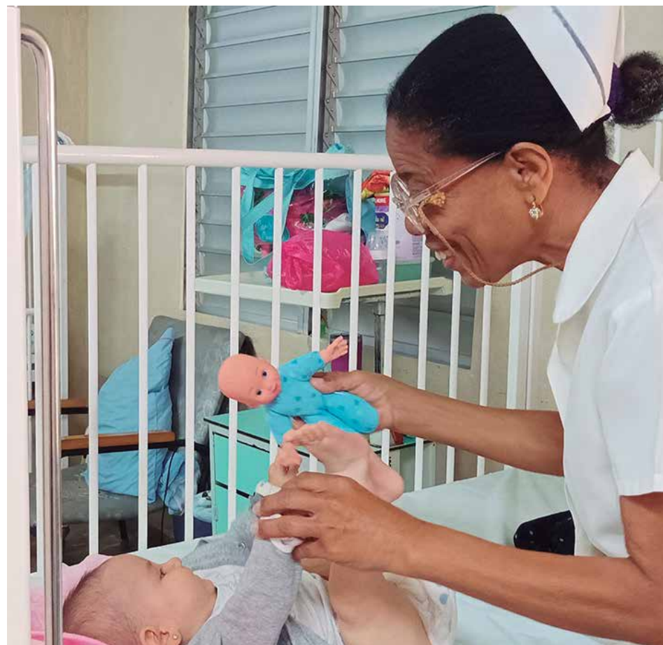
El Programa de Atención Materno Infantil presta especial atención a los niños menores de un año.

“Aun cuando no hay en existencia algún tipo de antibiótico, se llama a los expertos nacionales y se prioriza. Ningún paciente ha dejado de ser tratado debidamente; pero sí hemos tenido afectación con los equipos de ultrasonidos e insumos médicos, entre estos los catéteres.