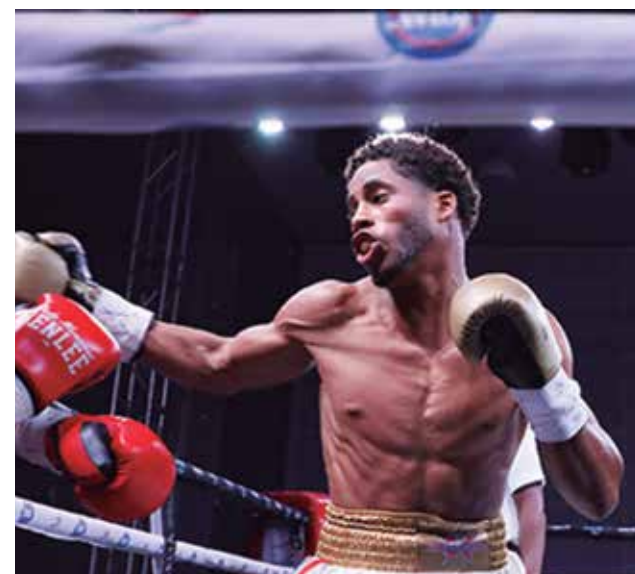
"Es mi segunda pelea profesional, significa mucho para mí y lo considero un gran paso en mi carrera deportiva", asegura.

La Liga Élite en su cuarta edición comienza este sábado. Desde entonces Sancti Spíritus estará conectada con sus Gallos vestidos con otros uniformes.