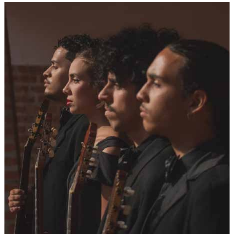
Cuerdas del Alma se muestra con sinceridad en la producción musical nominada.

“Como agrupación esperamos buenos resultados en Cubadisco 2026; pero cada nominación es un premio. ¡Y grande! No se trata solo de estar en la lista, sino de haber llegado con nuestro primer disco. Se transitó por un camino lleno de