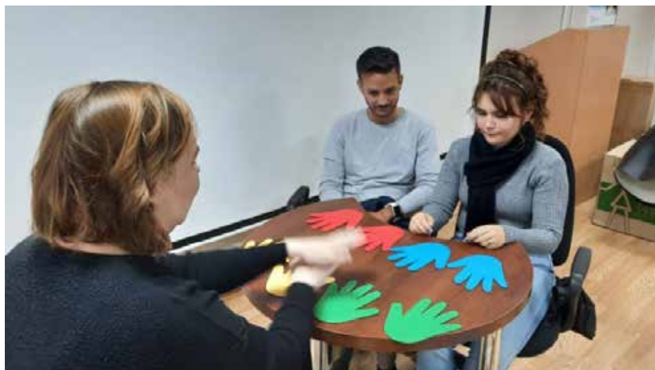
Técnicas con abundante colorido se utilizan para despertar el interés de los pacientes.

“El enfoque de ellos está más dirigido a la Neuroeducación, a la Logopedia, mientras que el de nosotros se centra, fundamentalmente, en la Psicopedagogía, la Psicología y la Educación Especial. En el contexto cubano se trabaja en la inclusión, es decir, cómo incluir, cómo integrar estos niños a la educación primaria regular, y eso fue algo que también llamó la atención a los especialistas de esa universidad rusa”.