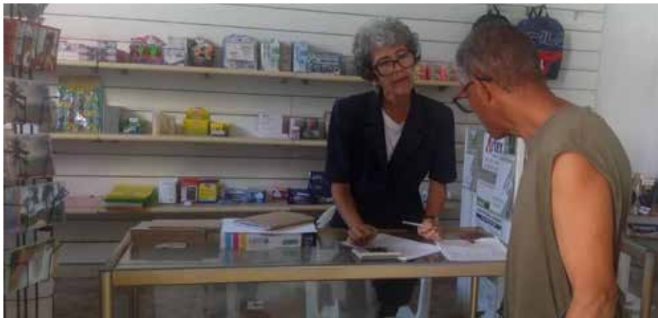
La sucursal espirituanana Empresa de Promociones Artísticas y Literarias Artex S. A. cerró el año con el plan económico cumplido.

Reconocimientos nacionales han legitimado el quehacer de entidades y trabajadores del sector con impacto en la sociedad