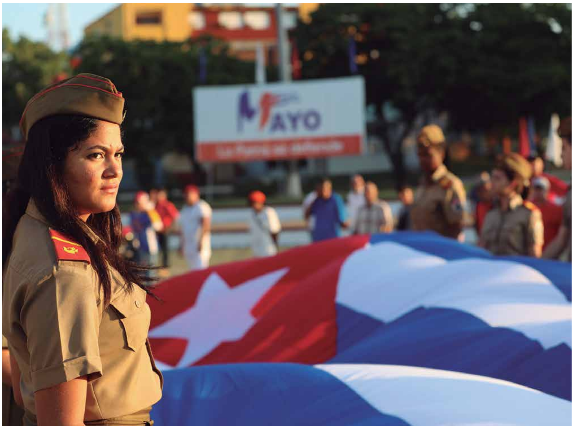
Los espirituanos ratificaron su fidelidad a la Patria