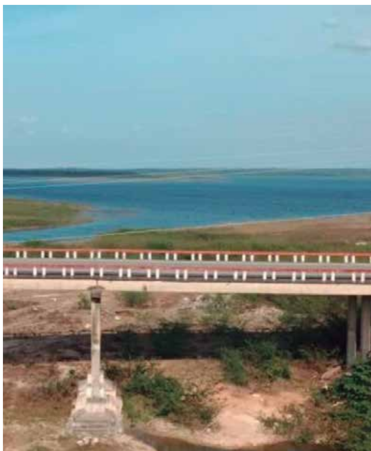
En el mes de abril la provincia acumula 45.7 milímetros de precipitaciones, para un 70 por ciento de la media histórica.

“El actual período seco (de noviembre a marzo) ha presentado un comportamiento favorable, con acumulados que superan la media histórica; sin embargo, estos valores no son significativos como para revertir la actual situación hidrológica”, añadió Lorenzo Coca.