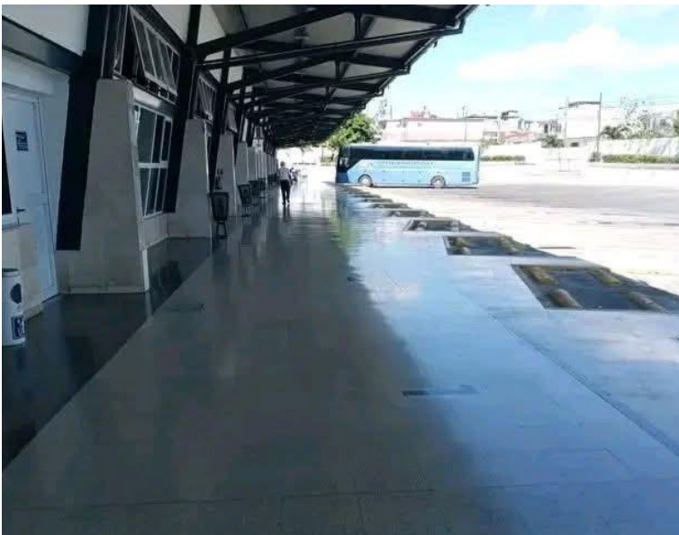
El territorio se prepara para ejecutar las acciones necesarias en consecuencia con las medidas adoptadas.