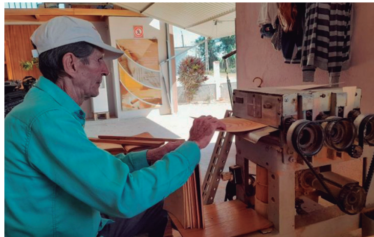
La entidad mantiene su producto estrella: las tablas laminadas entrecamadas de cedro para los envases del tabaco exportable.

Con menos de una veintena de trabajadores, esta iniciativa mantiene nexos contractuales con la Empresa Forestal de Sancti Spíritus y con el