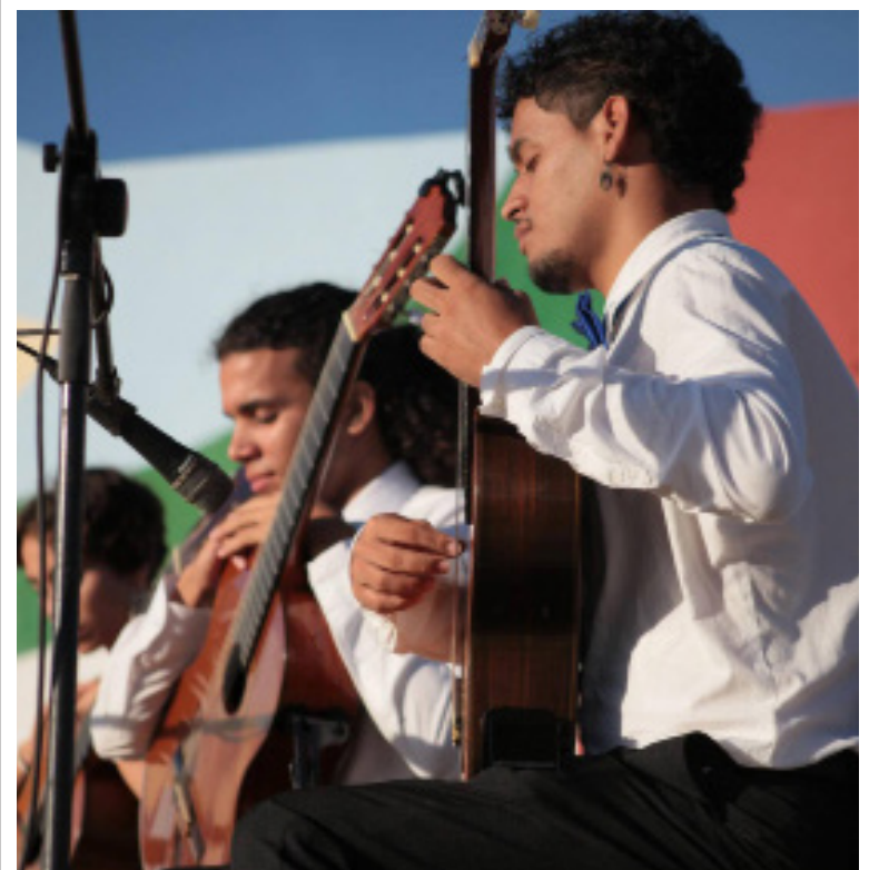
El proyecto sigue apostando por la música de concierto.