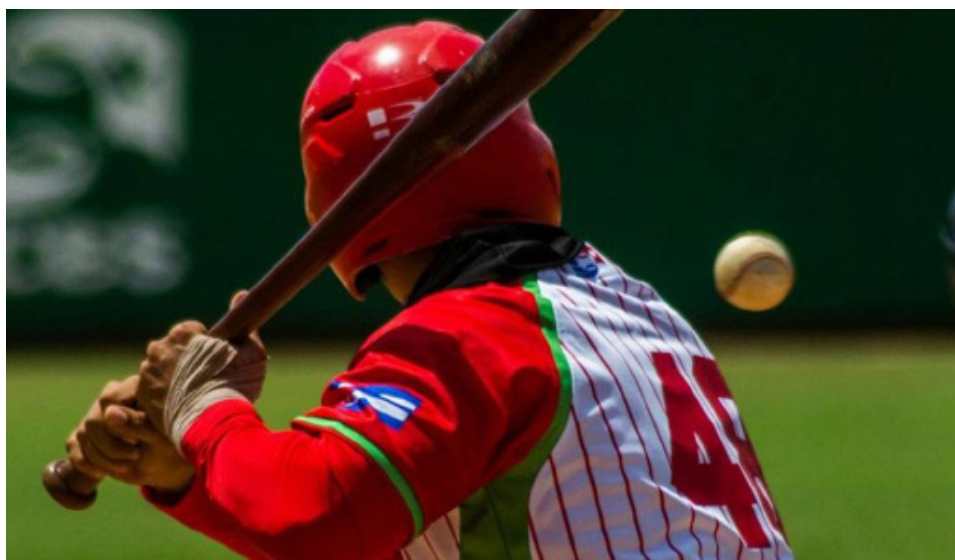
Liuber Gallo ha rendido muy bien con Las Tunas.

Varios de los Gallos insertados en los equipos de la lid van marcando huellas con su desempeño hasta la fecha