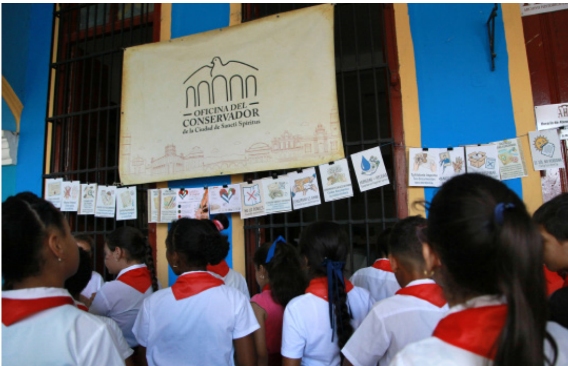
Los saberes que se replican en Sancti Spiritus llegaron aquí gracias a la colaboración de IILA.