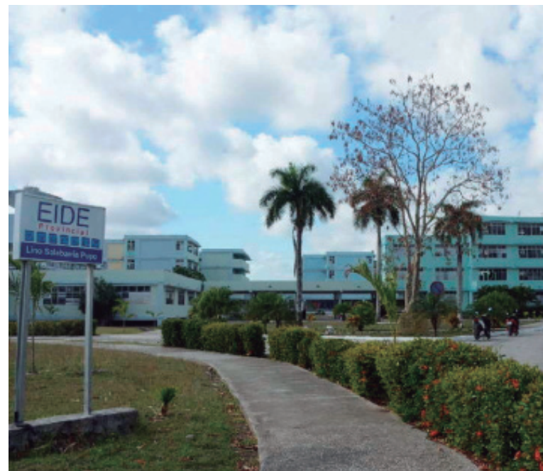
Como muestra de continuidad de la enseñanza en la escuela deportiva, por estos días se realizan las captaciones con vistas al próximo curso.

Como muestra de continuidad de la enseñanza en la escuela deportiva, por estos días se realizan las captaciones con vistas al próximo curso. “Con un gran esfuerzo de todos se realiza este proceso. Hay que explicar que muchos padres vienen buscando deportes específicos, como fútbol, béisbol, los cuales tienen una buena reserva en los combinados deportivos y sus categorías inferiores y para que entre un niño de décimo grado a ocupar una plaza ahí tiene que ser un talento, un pitcher que tire duro o algo así. Sí buscamos a los que quieran natación a partir de sexto grado, hockey, pesas, lucha y los deportes de combate en general, que es el grupo deportivo más afectado. Como no hay condiciones para el transporte, los interesados pueden venir a la escuela desde ahora y durante todo el mes de junio, aunque también existen