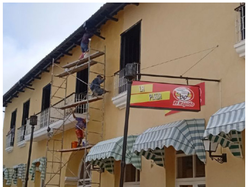
Varios de los integrantes de la mipyme Carmona son los encargados de los trabajos de reanimación y pintura en algunos de los edificios más significativos de la villa.