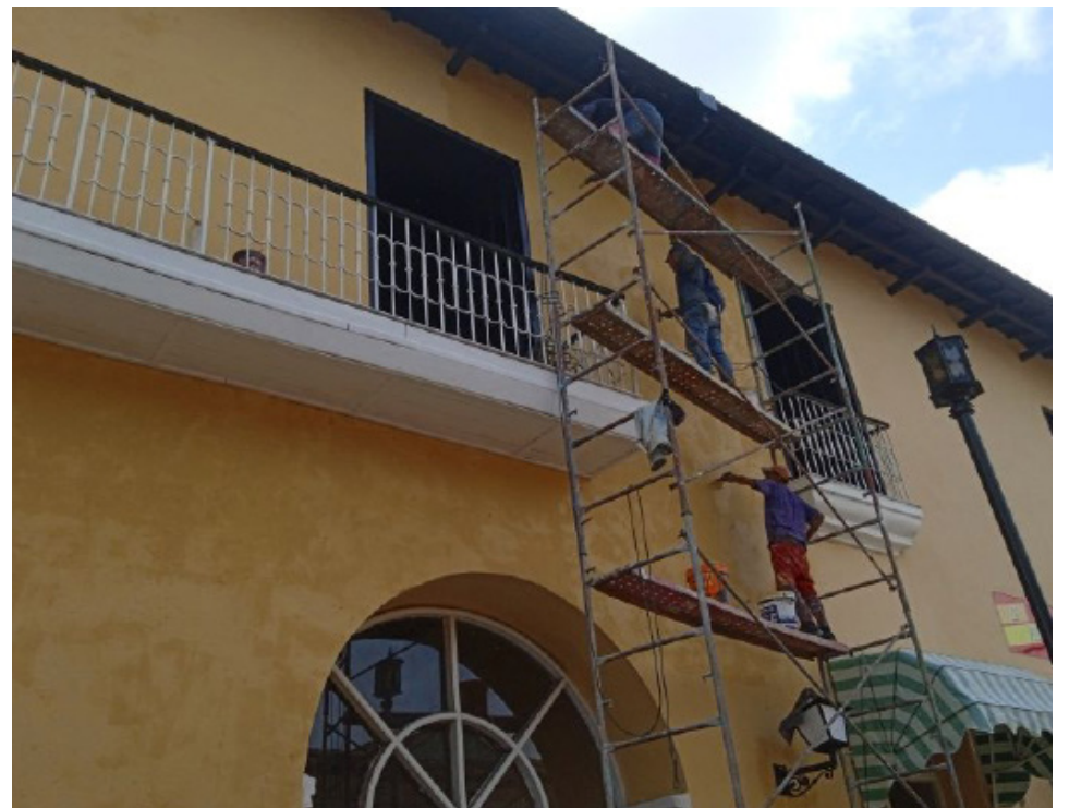
Se acerca el aniversario 512 de su fundación y el tiempo apremia para culminar las acciones previstas en saludo a tan significativa fecha.